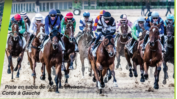
Piste en sable de 1250 m environ Corde à Gauche